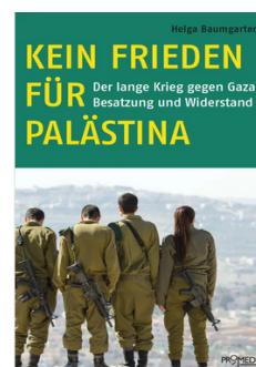
Cover: Tim Studler

Vortrag und Gespräch am Mittwoch, 15. Juni 2022, 19.00 Uhr Universität Bielefeld, X-Gebäude: Hörsaal X-E0-001*